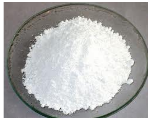
Специальные добавки (антикоррозионные, противомикробные, модифицирующие, пигменты и др.)