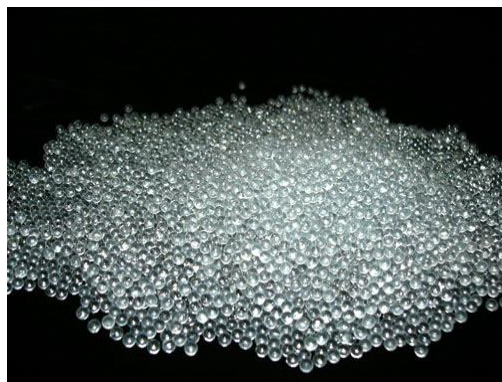
Стеклянные и керамические микросферы, заполненные вакуумом